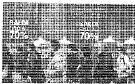
Saldi al via nei negozi, anche fuori stagione