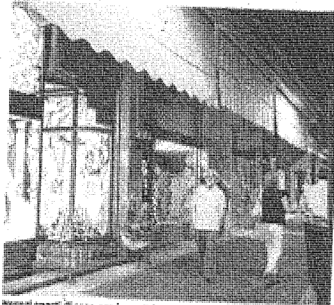
Negozi aperti di sera, ora è possibile per tutto l'anno