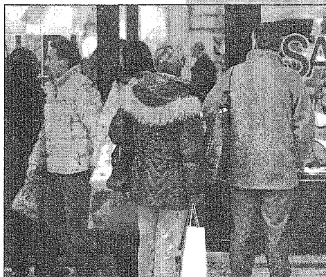
SALDI Da domani il via ufficiale delle vendite di "fine stagione"

non ha riscontri in nessun altro Paese del mondo. Mi sembra un po' la stessa storia dei metri quadrati della grande distribuzione che qualcuno ci voleva far credere fossero più in Europa che nel Veneto. Ed invece, con i nostri 465 mq per mille abitanti, rischiamo di essere noi i recordman continentali!».