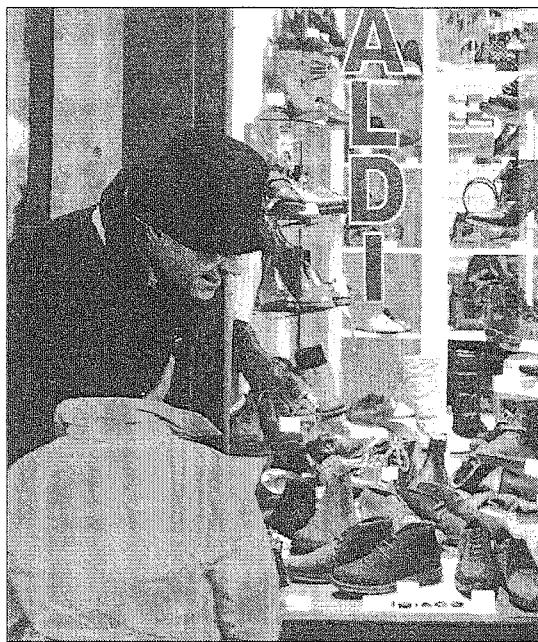
Foto ai prezzi esposti da confrontare poi con quelli ribassati