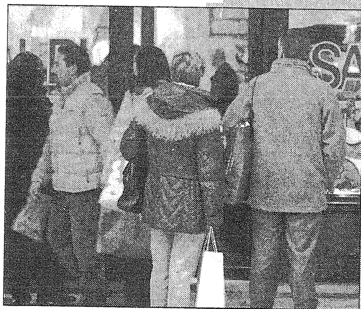
SALDI Da domani il via ufficiale delle vendite di "fine stagione"

«Non solo - conclude Rossi - ma anche questo ponte della Befana potrà essere interamente dedicato allo shopping, con i negozi autorizzati all'apertura in tutta la provin-