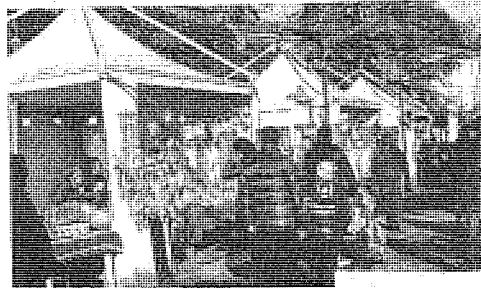
Il mercatino di Natale in centro ad Abano Terme