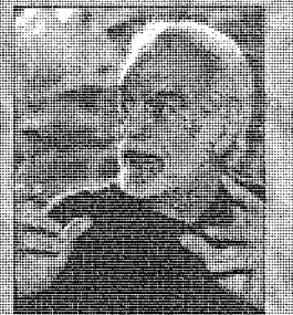
IL COLORE DEL LUSO L'attore Omar Sharif