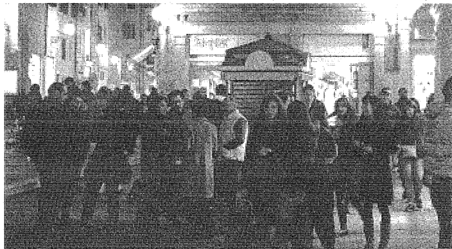
Padovani in piazza: la legge regionale di fine 2011 ha previsto sedici aperture festive, oggi il Tavolo fisserà il calendario

Di manovra in manovra. La liberalizzazione degli orari di apertura e di chiusura dei negozi, senza limiti di carattere turistico o artistico, è stata introdotta dal decreto legge «Salva Italia» (il 201 del 6 dicembre 2011). La norma era stata prevista dalla manovra correttiva, il decreto legge 98/2011 del 6 luglio, ma non era andato a buon fine. Il successivo Dl 136/2011 del 13 agosto aveva riproposto la possibilità di apertura no stop dei negozi, bloccata in sede di conversione in legge 148/2011, che l'ha limitata ai negozi e alle attività commerciali ubicate in località turistiche e città d'arte. Ora il Dl 201/2011 ha previsto che tutti i negozi e le attività commerciali, di qualsiasi regione italiana, possano restare aperti 24 ore su 24, anche a Natale, a Capodanno, a Pasqua e nelle altre festività. Ma la legge regionale 30 del 27 dicembre 2011 ha stabilito che le attività di commercio al dettaglio possono restare aperte dalle 7 alle 22 e osservano la chiusura domenicale e festiva. Deroga a dicembre e in altre 16 festività.